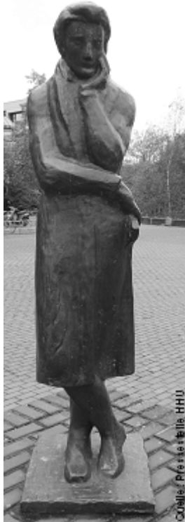
Heinrich Heine (1797 – 1856)